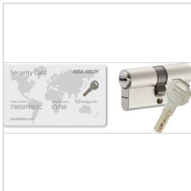
Code 007319 - Cylindre de sûreté CY110