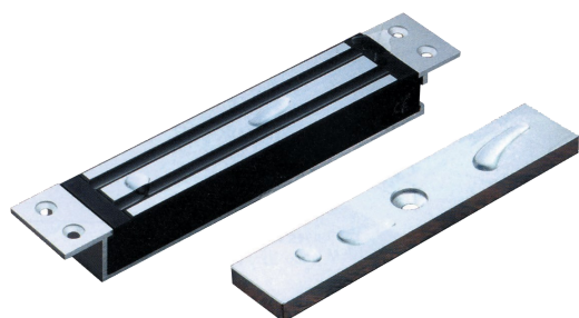
IGEM 2/IGEM 1